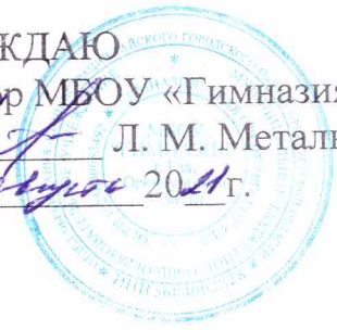
График контрольных работ на 2021-2022 учебный год начальная школа